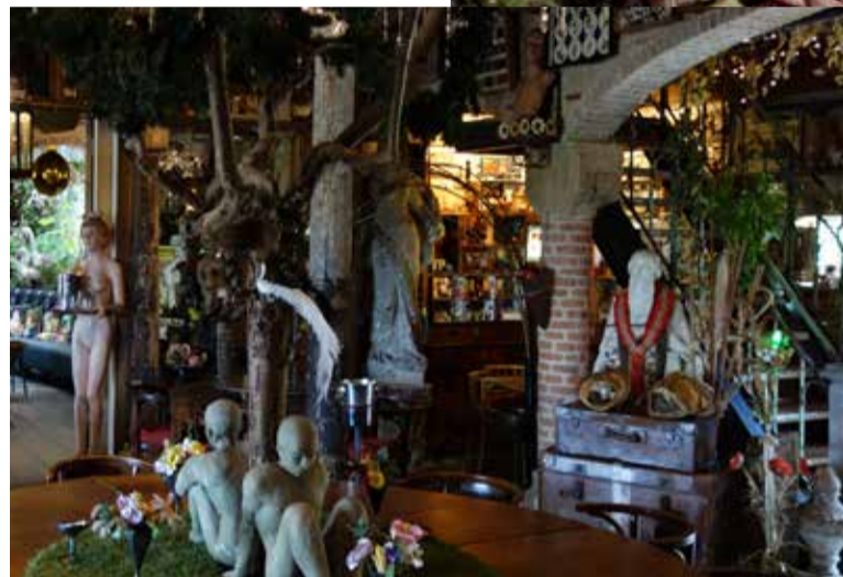
Monument Van Riel te Heukelom

van de thematische jaren 20 etc. interieurs) dan is dat misschien alleen te vangen in de begrippen nostalgie en heimwee. Kijken is dromen. Historisch gesproken zijn de inrichtingen rariteitenkabinetten . Het interieur is cultuurdivers en meer of minder exotisch. Een vijfde aspect is de bemoeienis van de buitenwereld door enerzijds de inrichting pejoratief te benoemen (bizar, gek, hilarisch, rommelig) of anderzijds juist de benaming van vrolijk, sprookjesachtig en anti-grijs te geven. Maar uitgesproken is de mening van de bezoeker absoluut! Ook is er een horror vacui , een angst voor de leegte. Nergens is er 'geen inrichting'. Vloer en plafond en de vier muren