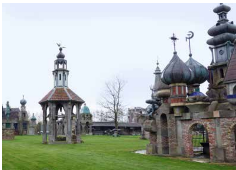
Klein Kremlin te Winkel