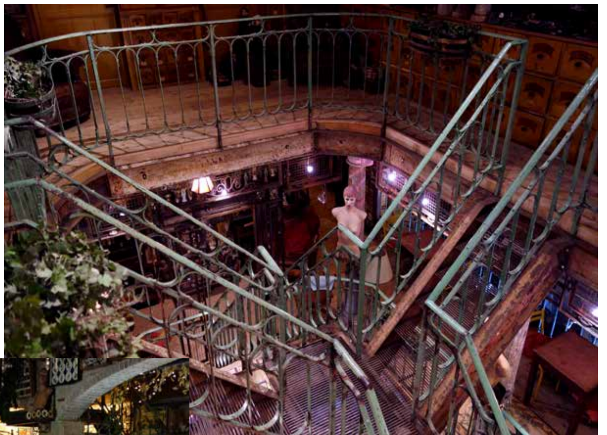
Meerdere gietijzen trappen in Monument Van Riel leiden naar 1ste en 2de etage

zijn gevuld en omsluiten een oneindige en overdadige hoeveelheid spullen. Dat resulteert vaak