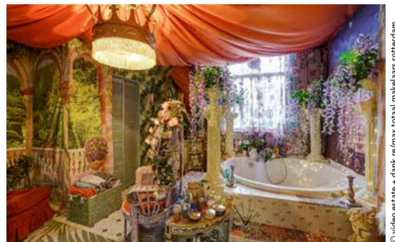
Huis Marilu te Schiedam

op onze primitieve instincten. Zo moet het veilig zijn dus niet overal glas maar juist ook muren want die geven de suggestie van dekking tegen onzichtbaar gevaar. Wij willen ons kunnen terugtrekken dus maken we hoekjes voor bepaalde activiteiten. Soms zelfs willen we andere ruimten want de auditieve privacy is misschien nog