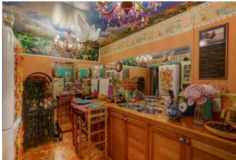
Keuken Marilu te Schiedam

waarts duidt op het steeds belangrijker worden van het individu-zijn, het uniek zijn. Maar de filosoof Coen Simon legt de paradox bloot: hoe unieker de inrichting, hoe groter de kans dat we niet meer bij de groep horen, dus onze opdracht is een onmogelijke: het interieur moet tonen dat we nergens bij horen zonder dat we buiten de maatschappelijke orde vallen.