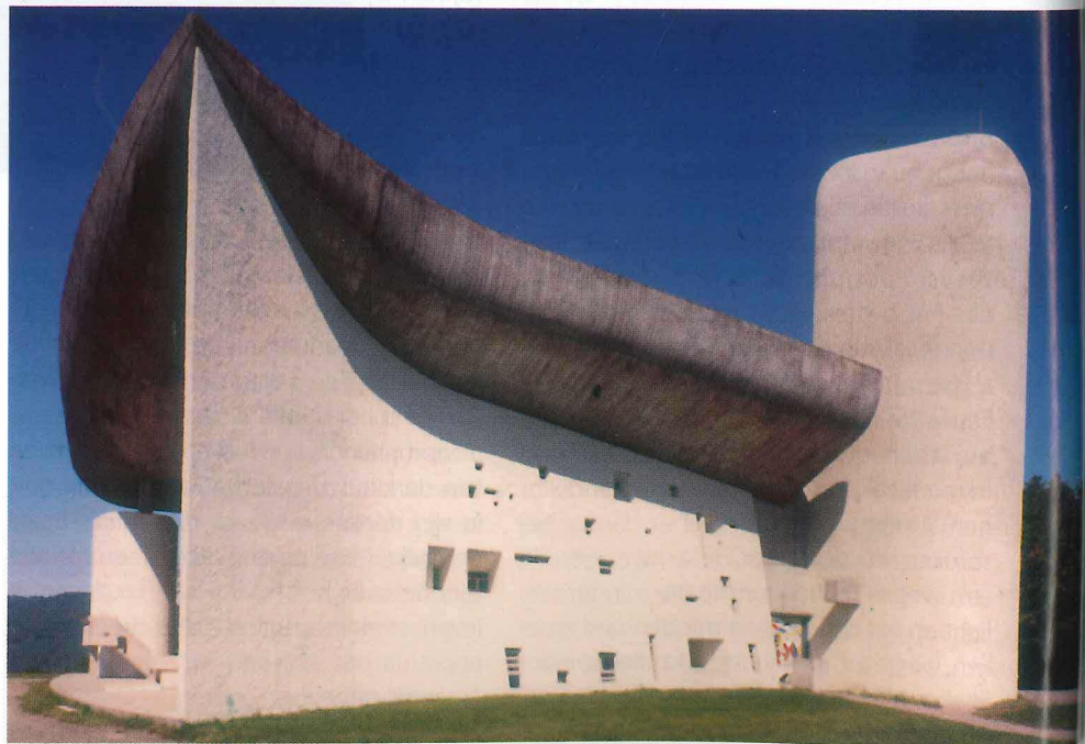
De Notre Dame du Haut in Ronchamps www.joostvansanten.nl