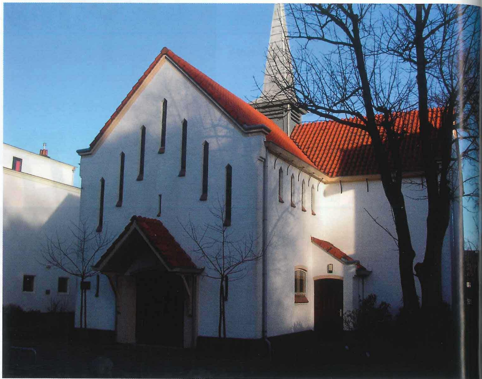
Het prachtige witte kerkje in Bussum

Black Bazaar (Design Dilemmas), uitgeverij 010 publishers; 2003 ISBN 90 6450 512 8; €14,50